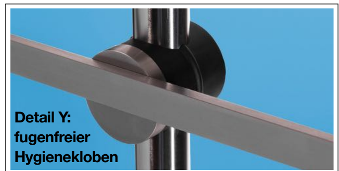
Detail Y: fugenfreier Hygienekloben

Anbau-Pumpenträger POMPA-VITA Format ca. 560 x 1.000 mm hoch - 4,85 kg