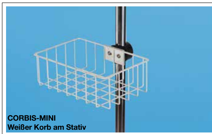
CORBIS-MINI Weißer Korb am Stativ

Korb CORBIS-MINI Maße außen ca. 300 x 200 x 100 mm hoch