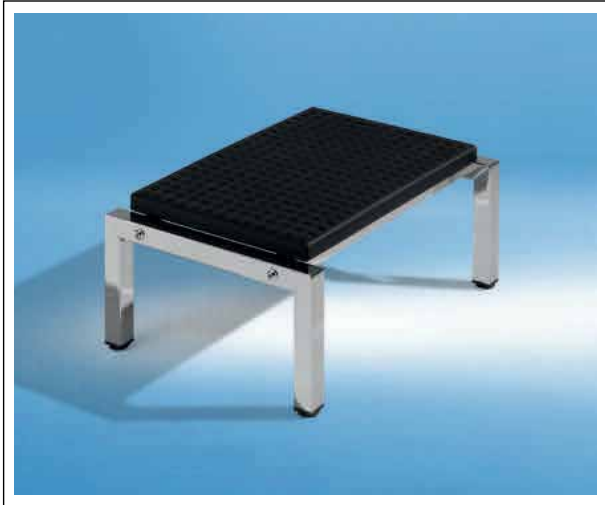
EDITUS-UNO verchromt Trittfläche 45x 30 cm