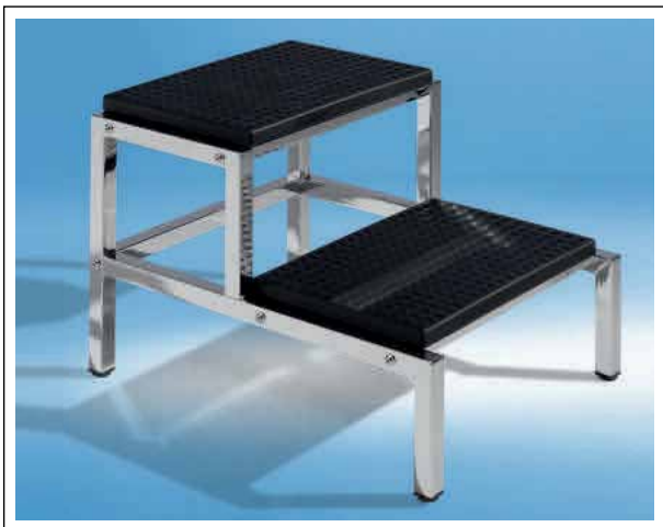
EDITUS-DUO verchromt Trittflächen, 2 Stück à 45x 30 cm