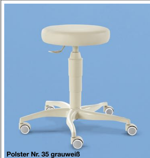
Polster Nr. 35 grauweiß