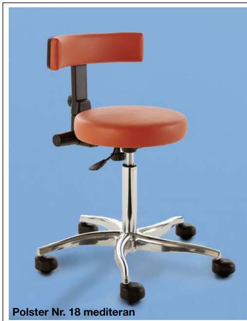
Polster Nr. 18 mediterran

mit Hebelauslösung und massivem, poliertem 5-Fuß-Gestell aus Aluminium, mit geprüfem Sicherheitsgaslift