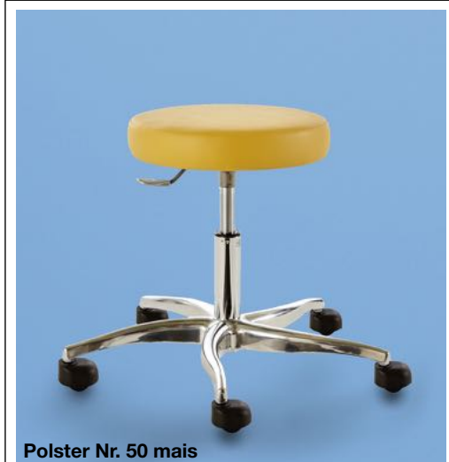
Polster Nr. 50 mais

Nur mit Hocker lieferbar Ersatzrollen auf Anfrage zu bestellen!