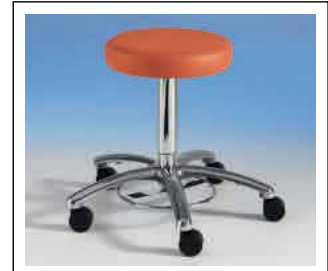
PEDES – hygienische Fußaus- lösung, Made by SIMPEX. Nicht möglich bei GYN-Höhe. Nr. 43 28