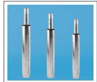
Incl. longlife STAB-O-MAT*-LIFT.