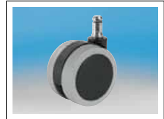
Mehrpreis für 5 weiche Rollen Ø 65 mm (PVC, Laminat, Granit, Fliesen, etc.)

Nr. 68 706 cpl. € 8,-/Set Nur mit Sitzmöbel lieferbar! Ersatzrollen auf Anfrage zu bestellen