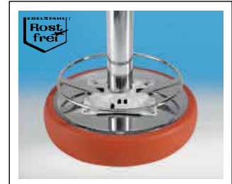
Incl. desinfizierbarer Edelstahl- Abdeckung der Sitzunterseite