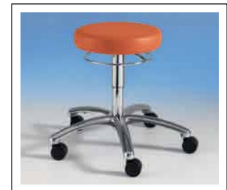
Ringauslösung, Made by SIMPEX Nr. 68 700 verchromt Mehrpreis € 40,-