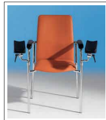
Sichere Stütze beim Aufstehen