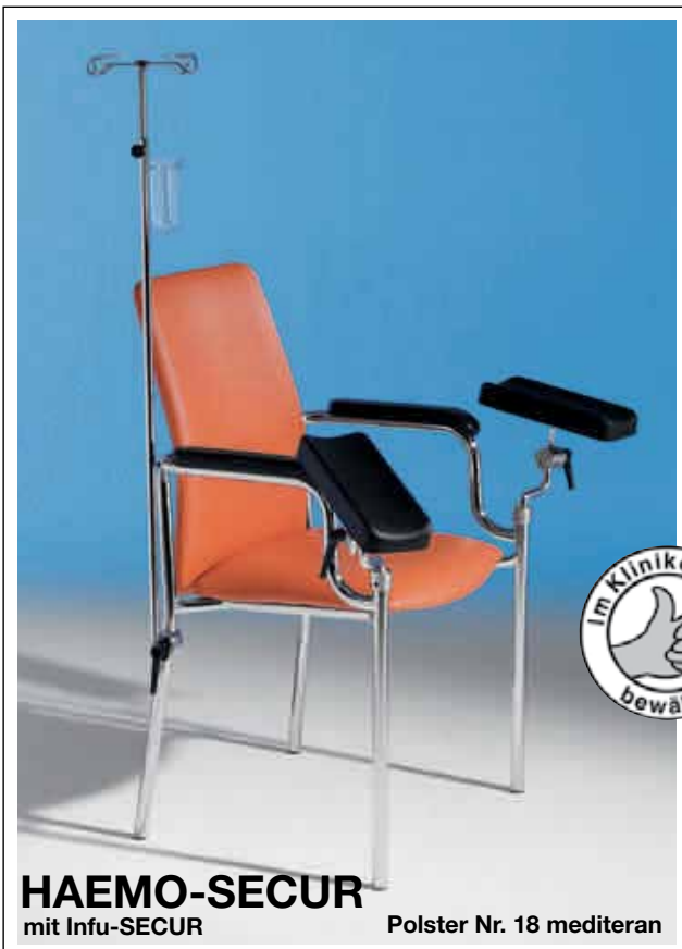
HAEMO-SECUR mit Infu-SECUR