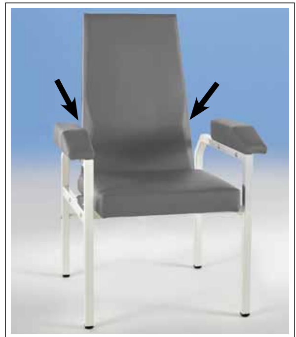
LORDOSENSTÜTZE für mehr Sitzkomfort beim Modell HAEMOSTAT-XL