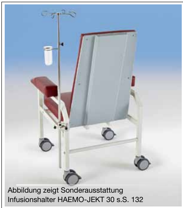
Abbildung zeigt Sonderausstattung Infusionshalter HAEMO-JEKT 30 s.S. 132

Mobilfahrwerk HAEMOSTAT-XL mit 4 leichtgängigen rundum einzeln feststellbaren Doppelrollen Ø=100 mm mit Totalfeststeller