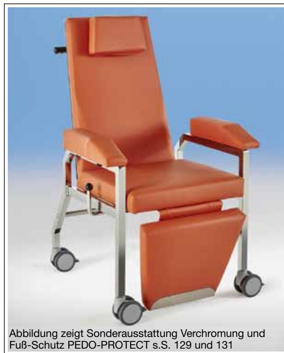
Abbildung zeigt Sonderausstattung Verchromung und Fuß-Schutz PEDO-PROTECT s.S. 129 und 131

Nr. 43 49 Mehrpreis Infusionshalter € 156,-