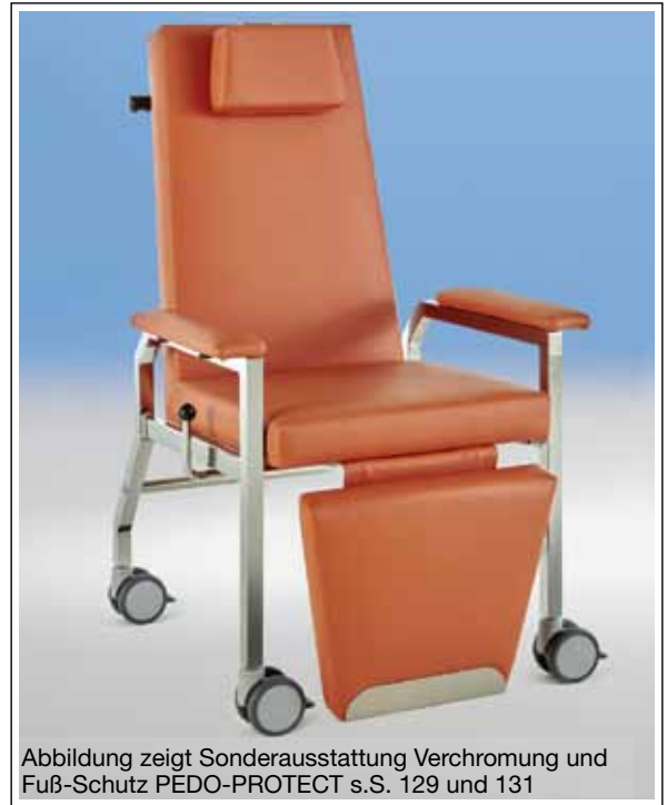
Abbildung zeigt Sonderausstattung Verchromung und Fuß-Schutz PEDO-PROTECT s.S. 129 und 131

Nr. 43 49 Mehrpreis Infusionshalter € 156,-