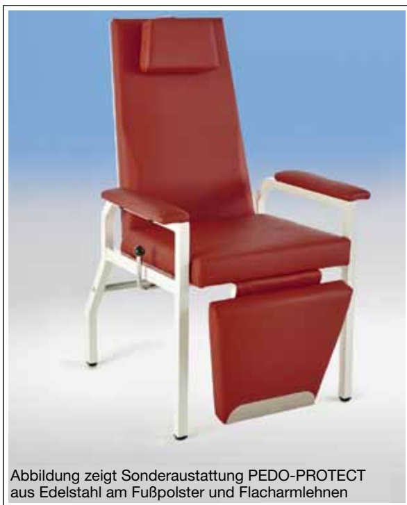
Abbildung zeigt Sonderausstattung PEDO-PROTECT aus Edelstahl am Fußpolster und Flacharmlehnen