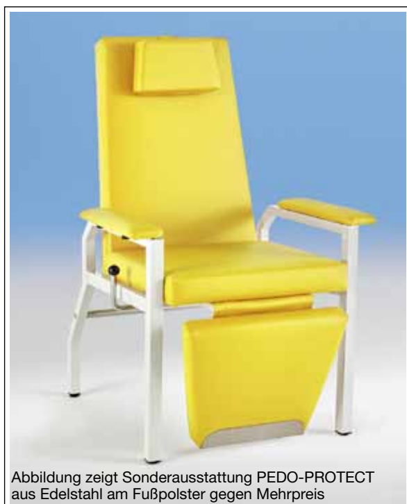
Abbildung zeigt Sonderausstattung PEDO-PROTECT aus Edelstahl am Fußpolster gegen Mehrpreis