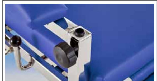
Verdeckt unter Armlehne mit Zubehöradapter