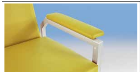
Verdeckt unter Armlehne seriemäßig mit Stopfen