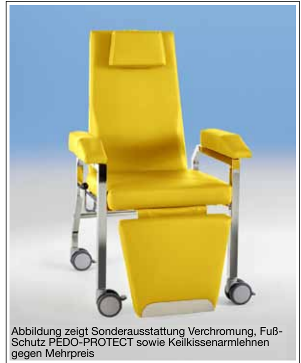
Abbildung zeigt Sonderausstattung Verchromung, Fuß-Schutz PEDO-PROTECT sowie Keilkissenarmlehnen gegen Mehrpreis

Verchromte Teile können Edelstahl in Hygienebereichen nicht ersetzen! – Alle Preise + Mehrwertsteuer.