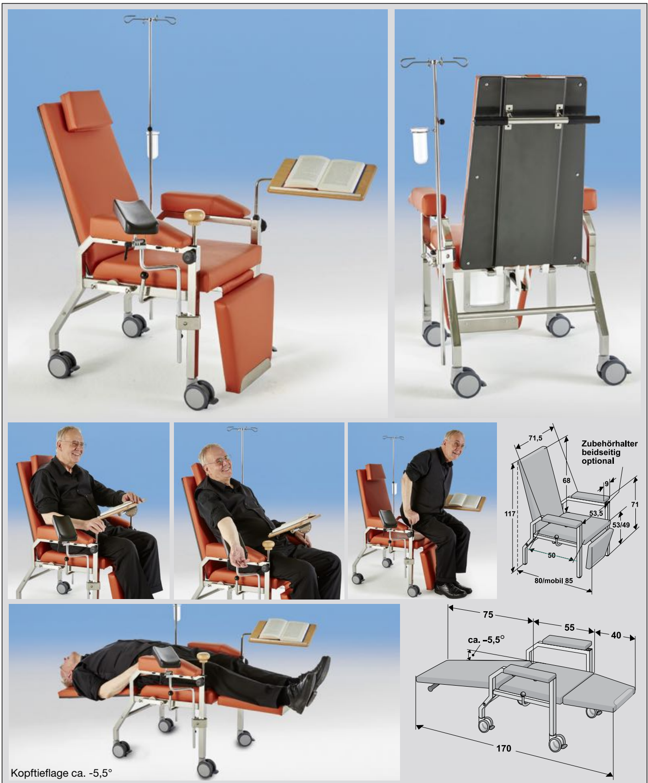
Kopftieflage ca. -5,5^\circ

VARIANT-MOBIL-PROTECT in Maximalausstattung zeigt das verchromte Gestell, die Rollenausstattung mit Schiebegriff, das Rückenpolster mit Lordosenstütze und hygienischer Rückenabdeckung in CARBON -Optik, das Fußpolster mit Schutzabdeckung PEDO-PROTECT aus Edelstahl, die praktischen um 7 cm verschiebbaren Keilkissenarmlehnen, den vielseitigen Ablagetisch HAEMO-WOOD , den höhenverstellbaren 4-fach-Infusionshalter HAEMO-JEKT mit Tropfglas, den Drainagebeutelhalter DRA-PORT , den Stützknauf PORTA-FIX und die vielseitige Armauflage HAEMO-SERVUS .