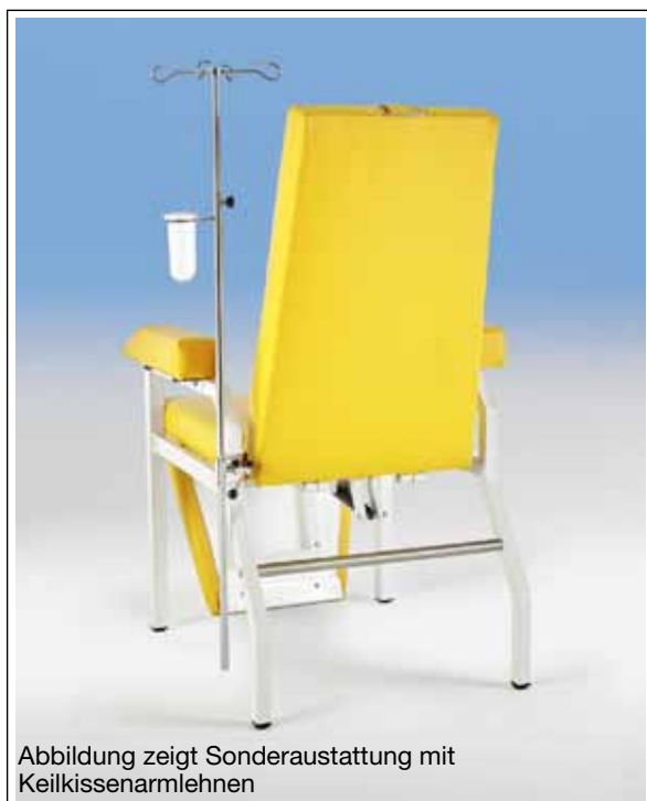
Abbildung zeigt Sonderausstattung mit Keilkissenarmlehnen

Nr. 40 354 Gestell grauweiß ab € 1.211,-