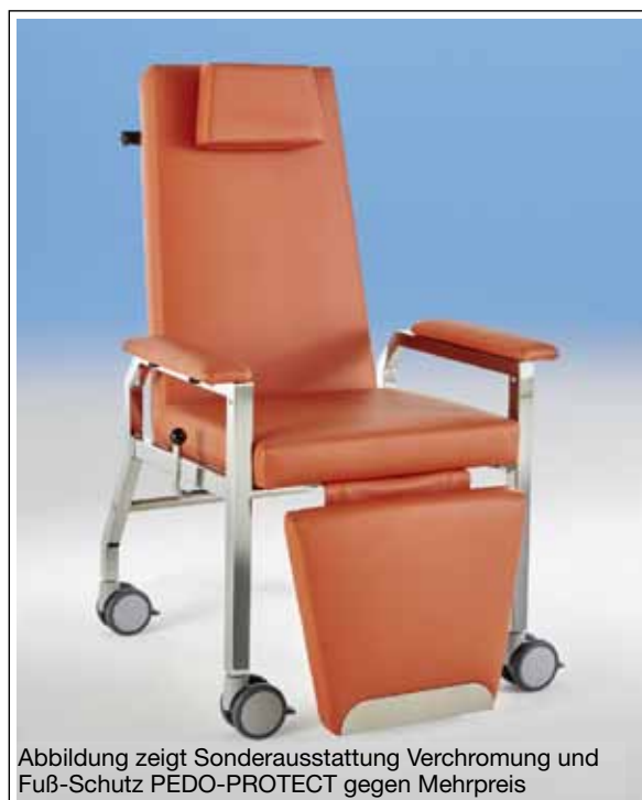
Abbildung zeigt Sonderausstattung Verchromung und Fuß-Schutz PEDO-PROTECT gegen Mehrpreis

Nr. 40 353 Gestell grauweiß ab € 1.033,-