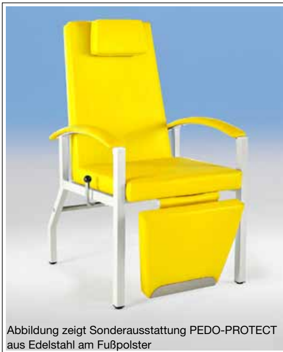
Abbildung zeigt Sonderausstattung PEDO-PROTECT aus Edelstahl am Fußpolster