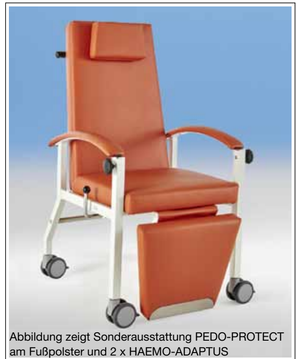
Abbildung zeigt Sonderausstattung PEDO-PROTECT am Fußpolster und 2 x HAEMO-ADAPTUS

Nr. 40 349 Gestell grauweiß ab € 1.022,-