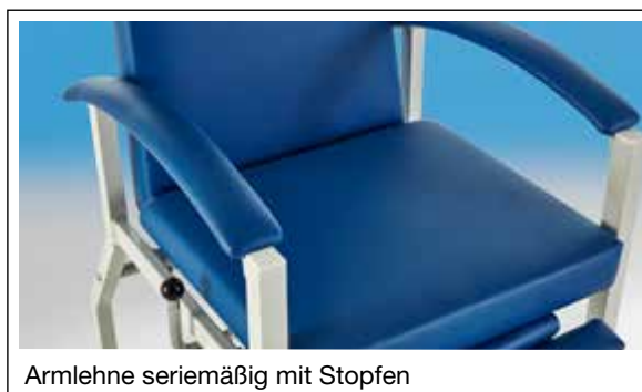
Armlehne serienmäßig mit Stopfen