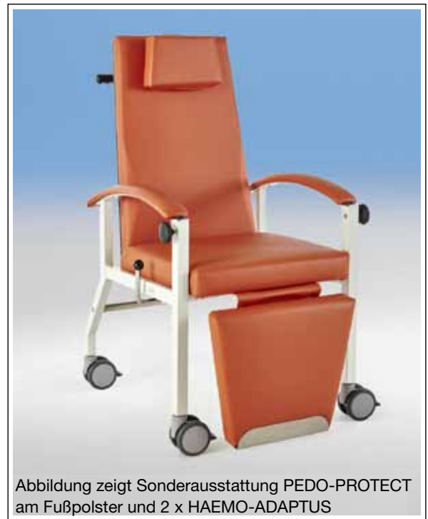
Abbildung zeigt Sonderausstattung PEDO-PROTECT am Fußpolster und 2 x HAEMO-ADAPTUS