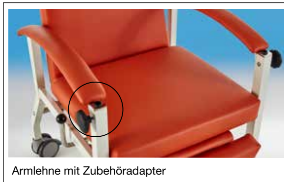
Armlehne mit Zubehöradapter

HAEMO-FLEXA mit Infusionshalter COMPOJEKT Nr. 39 27