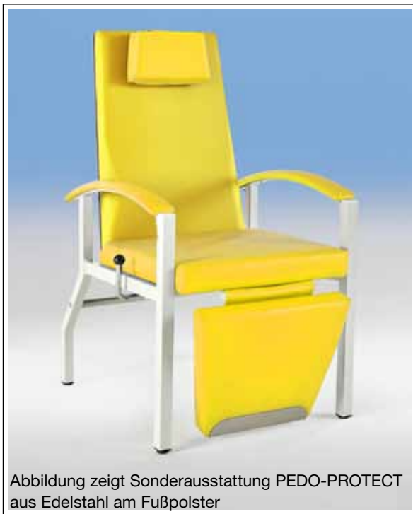
Abbildung zeigt Sonderausstattung PEDO-PROTECT aus Edelstahl am Fußpolster