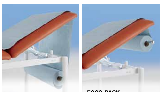
So war es früher!