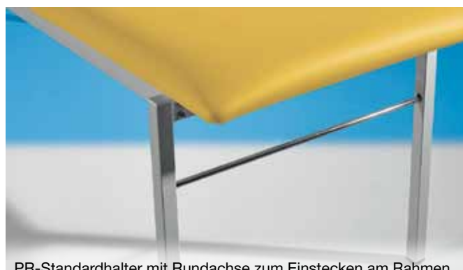
PR-Standardhalter mit Rundachse zum Einstecken am Rahmen des Kopfteils – Details lt. Preisübersichten