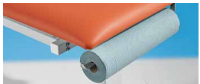
COMPO-BACK Papierrollenhalter zur Montage direkt unter dem Kopfteil bei den Varianten CLASSIC, SIESTA, ALTERNA und FLEXA-MED - spart Papier! Lieferung erfolgt ohne Papierrolle