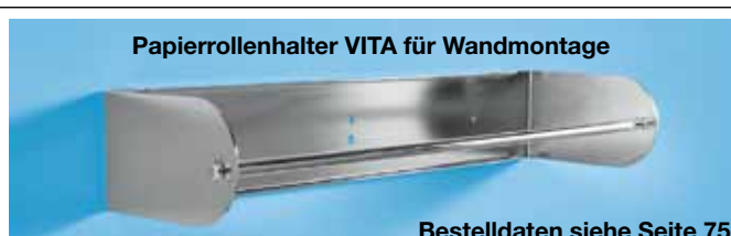
Papierrollenhalter VITA für Wandmontage