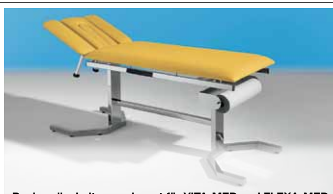
Papierrollenhalter verchromt für VITA-MED und FLEXA-MED Bestelldaten siehe Seite 75