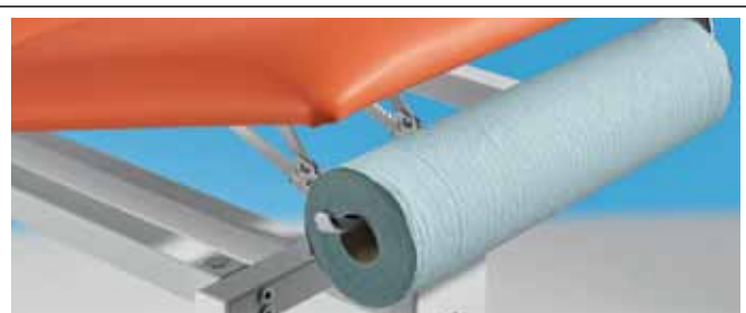
COMPO-BACK bei Kauf mit Liege Nr. 60 128 - 65 cm € 30,- / Nr. 60 129 - 80 cm € 38,- Nachkauf ohne Liege COMPO-BACK bei Nr. 60 130 - 65 cm € 59,- / Nr. 60 131 - 80 cm € 69,- Rollenbreite max. 59 cm / Rollenbreite max. 65 cm