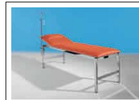
COMPOJEKT s.S. 110