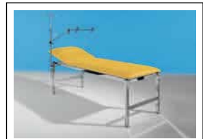
COMBIJEKT s.S. 110

VERTIKAL-Kloben NIRO-MOUNT wahlweise für Quadratrohre