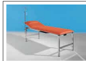
COMPOJEKT s.S. 110