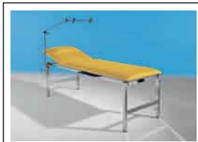
SILENTUM s.S. 110