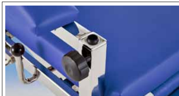
Verdeckt unter Armlehne mit Zubehöradapter