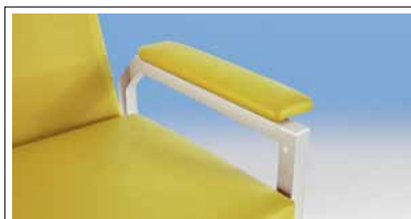
Verdeckt unter Armlehne seriemäßig mit Stopfen